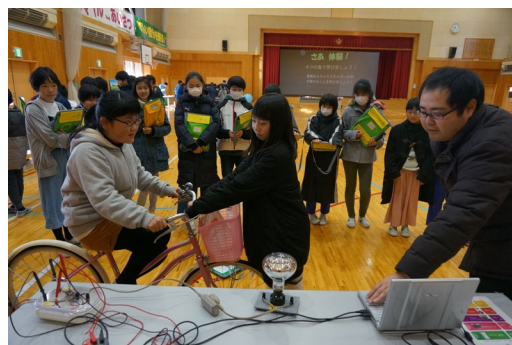
図4 矢巾東小学校での授業(総合学習「電気を賢くつくろう! 利用しよう!」(1-4校時; 8:45-12:10) 6年 96名; 2018.12.19)