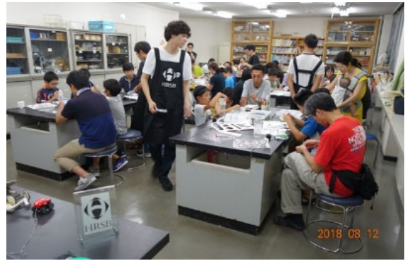
図5 盛岡市こども科学館「夏休み SPECIAL! ; ソーラーランタンを作ろう!」(2018. 8. 12)