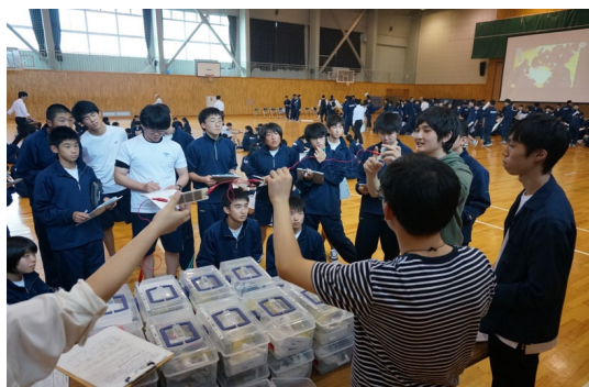
図3 授業の様子(盛岡第三高校; 2018.10.1)