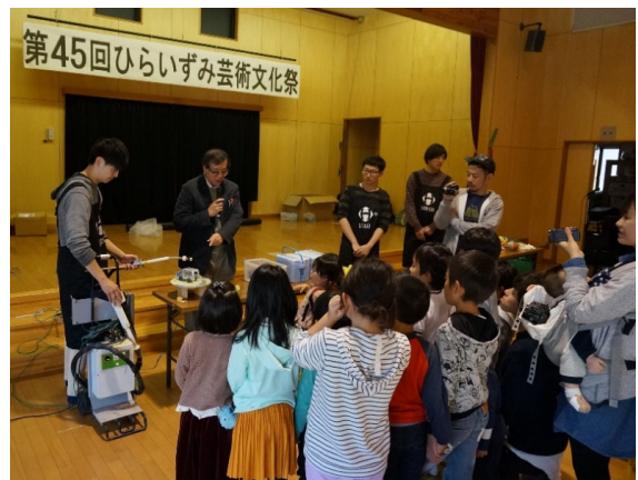
図6 第45回ひらいずみ芸術文化祭で実施した親子サイエンス教室の様子(2018. 1. 10)