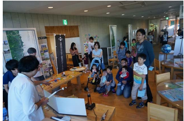
図 5 浄土ヶ浜ビジターセンターを会場として実施したサイエンス教室 (2017. 9. 23)

持続可能社会を指向したエネルギー環境教育の取り組みは、これまでもいろんな団体からの援助も受けて継続しており、活動期間は 10 年となる。いろんな機関と連携して活動を継続していること、効果的な学習プログラム開発などが評価され、平成 28 年度科学技術分野の文部科学大臣表彰;科学技術賞(理解増進部門;11 件受賞)を受けています。本活動は、HRSB 基金の助成のもとに実施されました。この場をお借りして、深く感謝申し上げます。