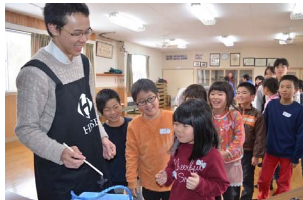
図 6 樋ノ口公民館を会場として実施した親子サイエンス教室 (2018. 1. 10)